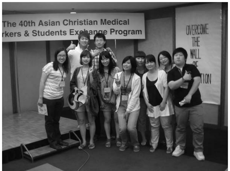
↑ 台灣、日本、韓國學生在會場合照

本生活。在mamemoyashi的支持與協助，以及韓國人長久向日本政府爭取福利的努力下，70年代政府終於開始供水供電，90年代開始收回那些非法木屋，為他們建立合法的住屋。這位韓裔牧師最後結尾時說，漸漸的，因著韓國人的下一代跟日本小孩一起長大，有些也跟日本人結婚，韓國人才慢慢得以融入這個社會。所以對牧師還有很多韓裔長輩來說，當他們看到現在韓國跟日本的後代，不分身份的一起相處，或是看到這些年輕人，一起相約去逛韓國街時，都會感到很大的欣慰。所以，在這兩天的student field work裡，我們透過第一個晚上韓裔牧師的分享，大略了解了住日韓國人的歷史後，隔天mamemoyashi帶我們參觀他們為韓裔長輩所設立的養老院與日托中心等等的設施。