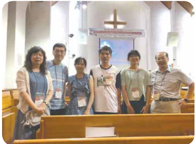
本文作者(右二)在韓國會場與部分台灣代表合影

在會議中各地區各國的處境，為神竭力服事，使我反思我（醫護人員）在職場健康中，我們通常怎麼做？而我們在基督信仰中還可以怎麼做？我領受了謙卑讓人自由的奧秘，因為人總有立場、眼光的侷限，但在健康是一個公共性的前提下，我更需要倚靠神，這是開放自己的時刻，同時也傾聽別人的經驗，讓神的愛流動在我們當中，讓我們經歷到信仰的真實性、個人性，包含了人一生所遇到所有境遇，而如何做出信仰的回覆。