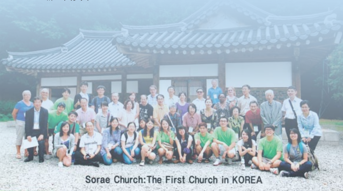
Sorae Church: The First Church in KOREA

台灣有13位出席，其中學生和Junior代表7位，會員代表有6位。大會其他與會國還有日本7位，韓國52位，香港5位、中國1位，蒙古2位，ICMDA執委會6位(肯亞1位、加拿大2位、荷蘭1位、美國1位、英國1位)，計86人參與。